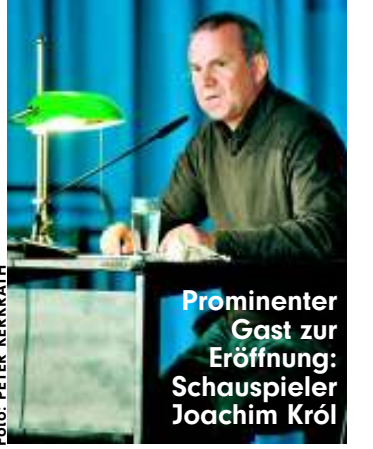
Prominenter Gast zur Eröffnung: Schauspieler Joachim Kröl

Dass die sich künftig ganz aufs Studieren konzentrieren können, dafür ist mit dem neuen Campus-Center auf jeden Fall gesorgt. ks