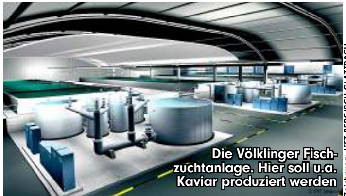
Die Völklinger Fischzuchtanlage. Hier soll u.a. Kaviar produziert werden