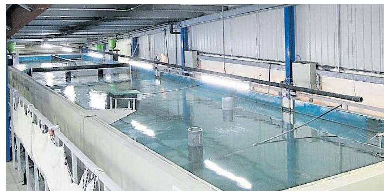
In der Testanlage im niedersächsischen Uetze-Eltze werden bereits Meeresfische gezüchtet.

Sander, aber Völklingen habe dadurch ein „Alleinstellungsmerkmal“, das international Aufmerksamkeit erzeugt. „Wir werden Forschungstourismus bekommen“, verspricht Professor Waller. Erstmals werden Waller und seine Kollegen aber selbst reisen, um von ihren Erfolgen zu berichten. Im Oktober steht die saarländische Anlage auf der Tagesordnung eines internationalen Fischereikonferenzen im portugiesischen Porto. Dann wird wieder gefragt: „Hey, Uwe, wie weit seid Ihr eigentlich in Völklingen?“