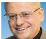
Von Thomas Spang

Aus deutscher Sicht enttäuschend: der Verbleib der amerikanischen B-61-Altbestände in der Bundesrepublik. Diese atomaren Gefechtsköpfe werden nicht einseitig abgezogen, sondern sollen Teil späterer Abrüs-